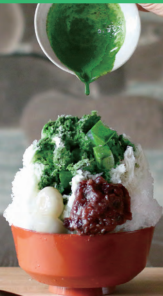
白いかき氷 単品1,350円 濃茶トッピング+220円